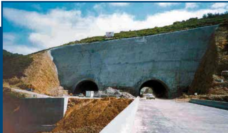
Incluso revegetamos taludes previamente gunitados (Baralla, Lugo – E)