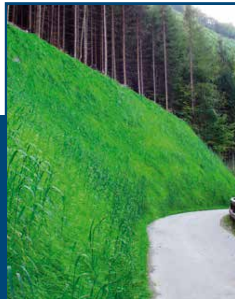
Estabilización final con el nuestro sistema